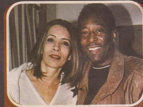
Com o eterno rei do futebol, Pelé