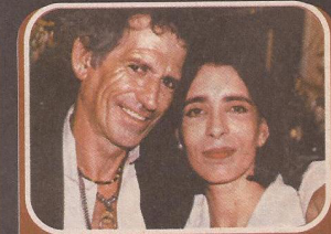
Com Keith Richards, dos Stones