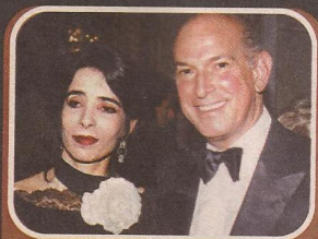
Dupla com Oscar de la Renta

"O GLAMOUR DE UMA FESTA SÃO OS CONVIDADOS. SOU IMPIEDOSA COM GENTE DESANIMADA E SEM ASSUNTO"