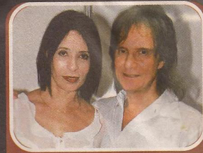
E o da música, Roberto Carlos