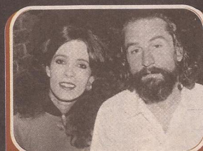
Com De Niro, 'amizade colorida'

Vieram os tempos de Collor e, com eles, a morte do cinema nacional. Liège, que tinha sido directrice do African Bar, lounge de Nelsinho Motta no Leblon, descobriu-se uma grande