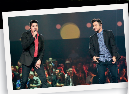
As duplas Henrique & Diego e Marcos & Belutti, que estava representando o sertanejo, levaram seus fãs à loucura aos cantar seus sucessos