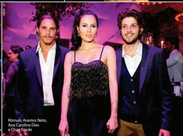
Rômulo Arantes Neto, Ana Carolina Dias e Chay Suede