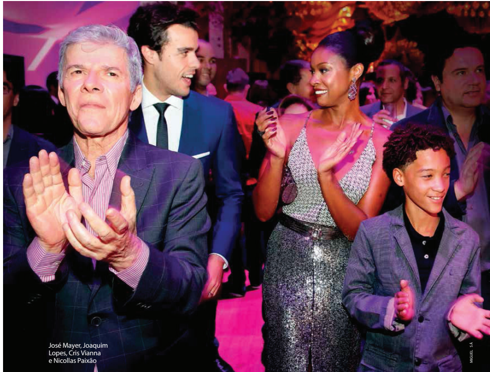
José Mayer, Joaquim Lopes, Cris Vianna e Nicollas Paixão