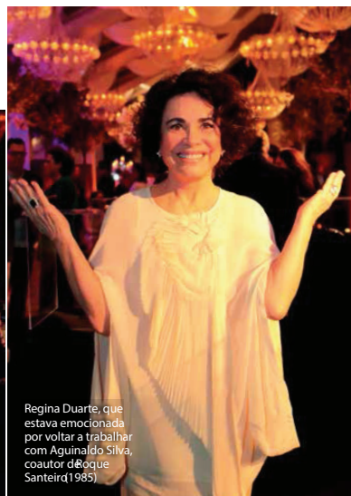
Regina Duarte, que estava emocionada por voltar a trabalhar com Aguinaldo Silva, coautor de Boque Santeiro (1985)