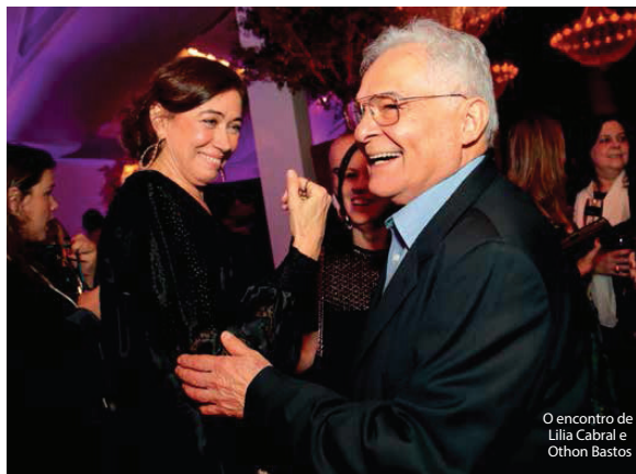
O encontro de Lilia Cabral e Othon Bastos