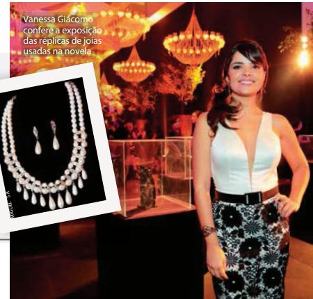
Vanessa Giacomo confere a exposição das réplicas de joias usadas na novela

■ José Mayer, 64, está achando positivo o burburinho em torno de seu personagem, o gay enrustido Cláudio, que terá cenas românticas com Klebber Toledo, 28. "Foi uma ruptura estética da minha imagem de galã, que estava solidificada. Isso renova o olhar do público em relação ao meu trabalho", comemorou, para defender em seguida o direito dos homens que preferem não assumir publicamente que são gays. Ele brincou que não consegue se imaginar no lugar do personagem. "Essa é uma hipótese difícil de exercitar na minha cabeça (risos). Mas eu acho que liberdade é a palavra-chave. Todo mundo é livre para ter o comportamento que bem entender não levantar uma bandeira."